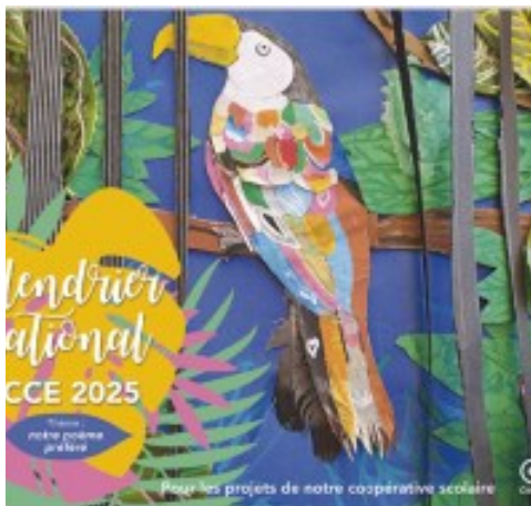
Calendrier national OCCE 2025 « Notre poème préféré »