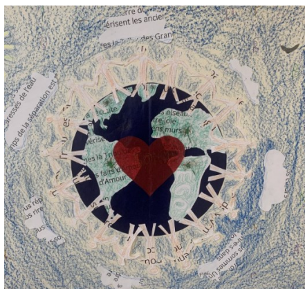
CE1/CE2 de l'école primaire « Kergomar-racamier » (26000 Valence)