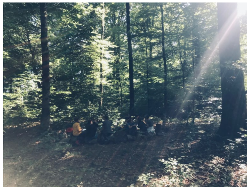
Rencontre école dehors Septembre 2025 Luxeuil-les-bains