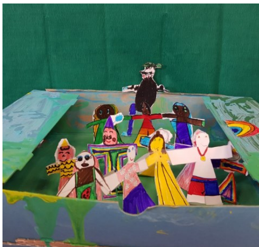
CE1 de l'école primaire « Calvinhac » à Toulouse (31000)