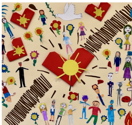
CM2 de l'école élémentaire « Gabriel Peri » à Chateaurenard (13160)