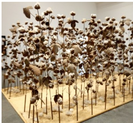
CP de l'école « Ecole de Dialaw » à Yenne - Ecole en poésie 2022