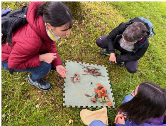
Rencontre école dehors Ecole L. Pergaud, Belfort Octobre 2025