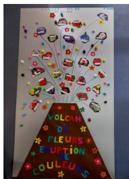
MG/GS de l'école primaire de l'école « Marguerite Couchoud » à saint Joseph (42800)