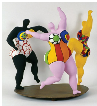
Les Trois Grâces, Niki de Saint Phalle

Toute l'équipe OCCE est ravie de vous retrouver